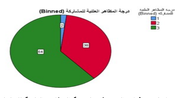
شكل ٤: فئات المبحوثين لدرجة المظاهر العلنية للسلوك